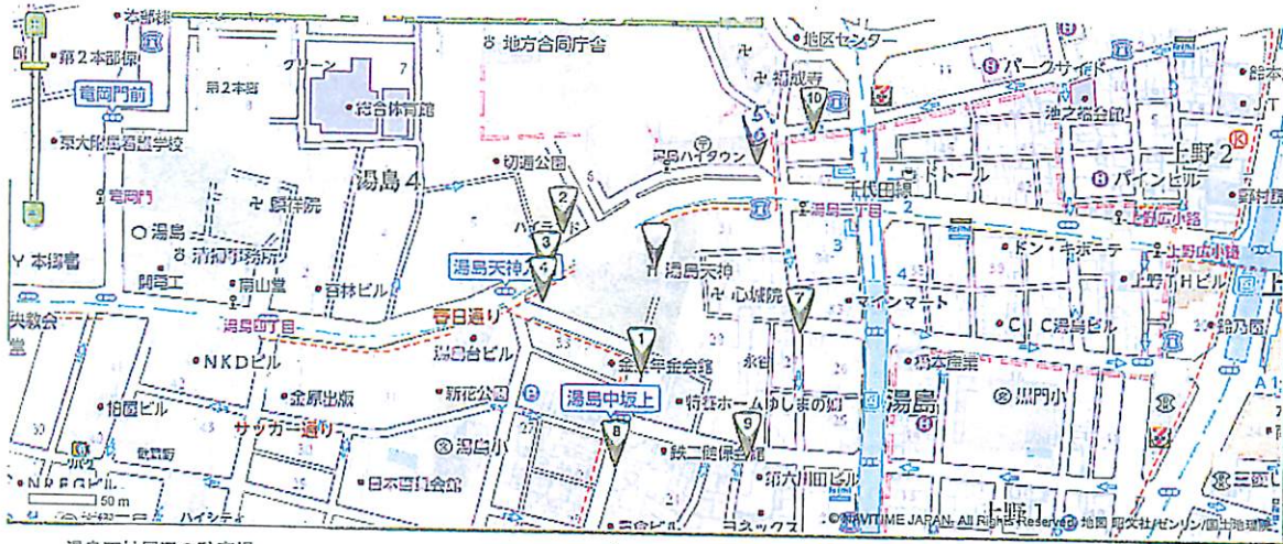
湯島天神周辺の駐車場